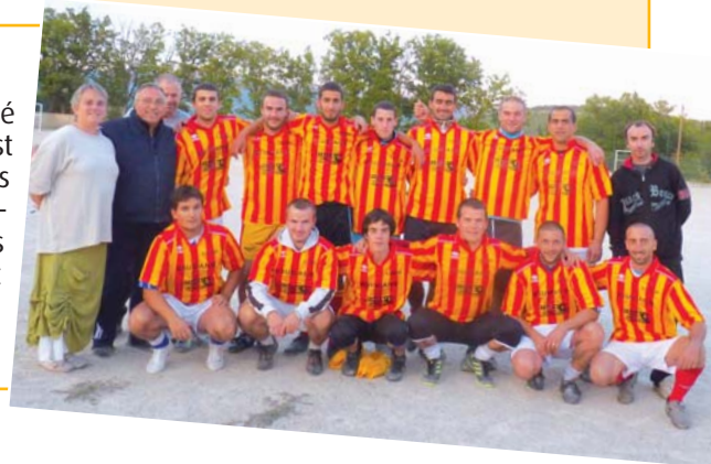
L'équipe seniors, l'entraîneur et les dirigeants